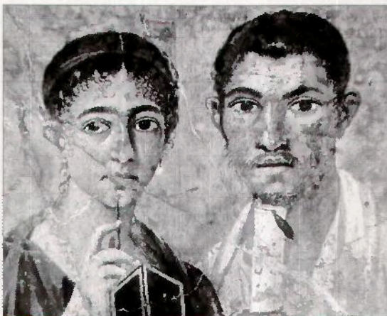
IL TRIONFO DEL CAPOLAVORO Sopra, scatto di Mimmo Jodice a Pompei. A sinistra, la copertina del libro sul tour

quella stagione, che vide il nostro Paese calamitare poeti, pittori e romanzieri. Ma anche un modo di reinterpretare la contemporaneità del sito archeologico