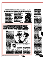
FOTO D'ANTICO Il grande fotografo e tre scrittori per rivivere i fasti del viaggio in Italia del XVII secolo